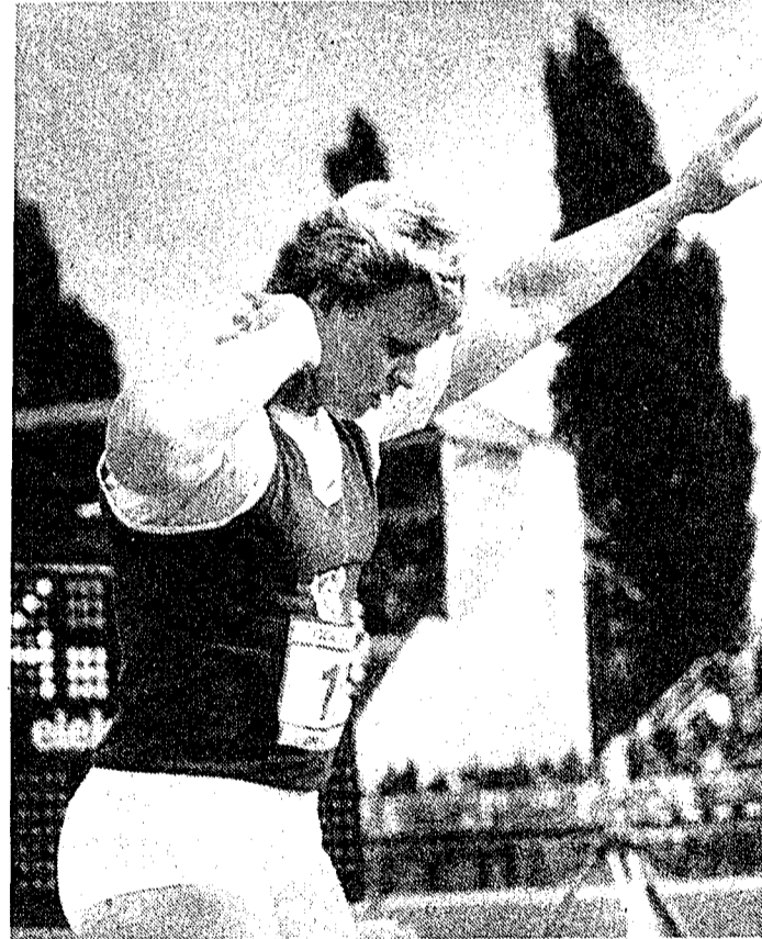
Die Beständigkeit in Person: Weltmeisterin Ilona Briesenick vom SC Dynamo Berlin.