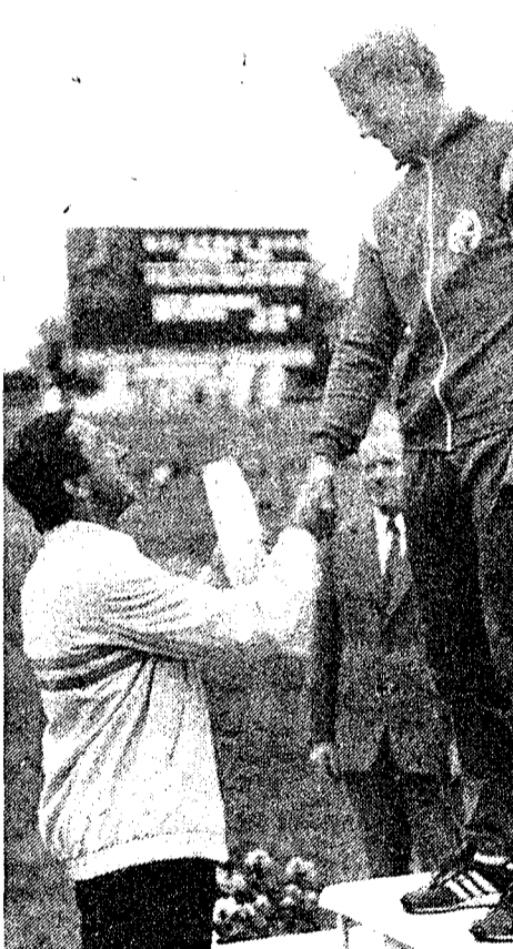
Lutz Dombrowski nimmt die Kristallvase für den Publikumsliebhaber der zwei Dresdner Tage entgegen.

Mit seinen fünf Sätzen riß der Karl-Marx-Städter Olympiasieger Lutz Dombrowski im Weitsprung die Zuschauer förmlich von den Sitzen. Seine beachtliche Serie: 8,21 m, 8,25 m, 8,42 m, ausgelassen, 8,50 m, 8,48 m. Für diese großartige Leistung erhielt er den Kristallpokal, der von der „Sächsischen Zeitung“ für den Publikumsliebhaber gestiftet worden war. Lutz Dombrowski sagte nach der Ehrung: „In Dresden starte ich immer wieder gern. Diesmal ging das Publikum von Anfang an voll mit, als ich im ersten Versuch gleich die 8,21 m schaffte. Das hat mich weiter angespornt. Den vierten Versuch ließ ich dann aus, um mich noch einmal für das große ‚Finale‘ zu konzentrieren. Es gelang mir auch. Ich freue mich sehr über die Auszeichnung als Publikumsliebhaber. Ein Ehrenplatz ist dieser Kristallpokal zu Hause sicher ...“